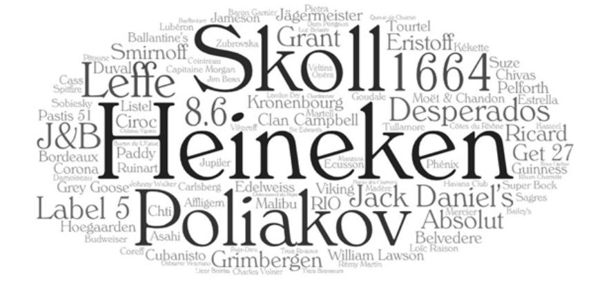
Figure 1. Nuage des marques d'alcool citées par les adolescents de 17 ans en référence à la dernière publicité mémorisée

Note de lecture : plus la taille de la police est grande, plus la marque correspondante a été fréquemment citée par les adolescents. Par exemple, la marque Heineken a été nommée 426 fois, Label 5 (à gauche) 57 fois.